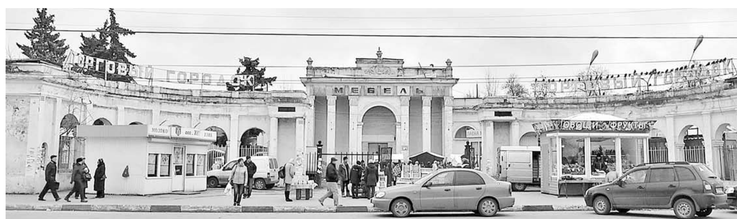
Павильоны Торгового городка теперь объекты культурного наследия области

По материалам официального сайта администрации г. Рязани