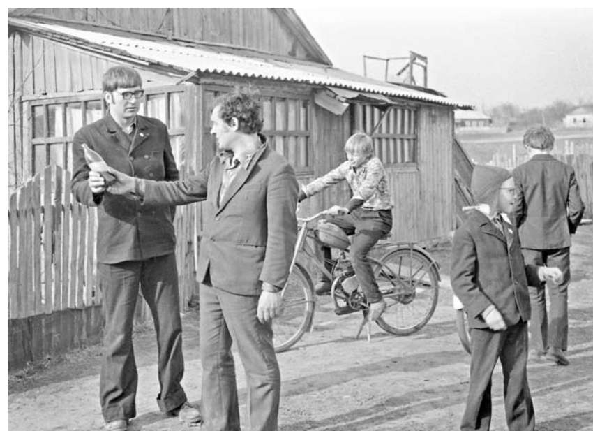
Мужики в селе Затисье