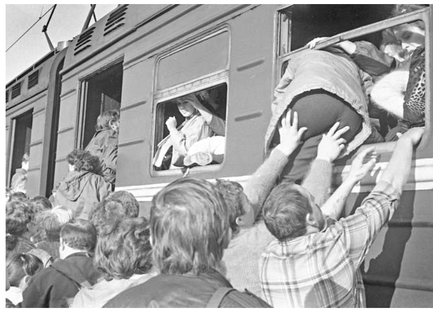
Посадка в электричку в Рязани, начало 90-х