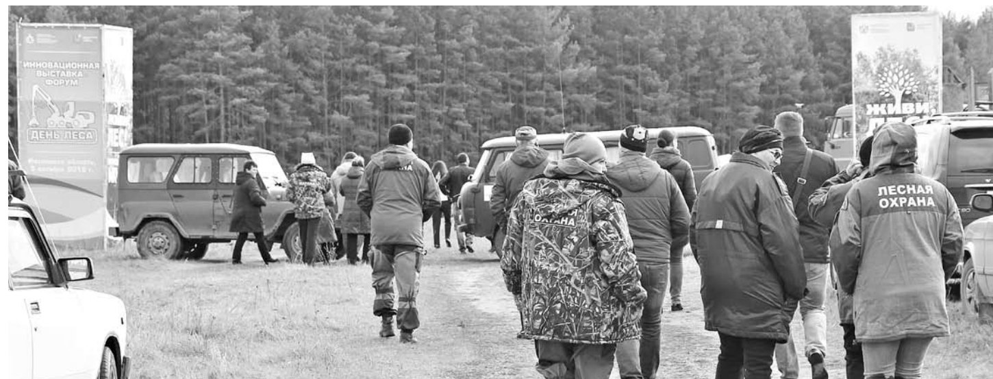
В Касимове на Дне леса состоялась межрегиональная научно-практическая конференция по вопросам лесовосстановления, сохранения и защиты лесов, внедрения современных методов мониторинга