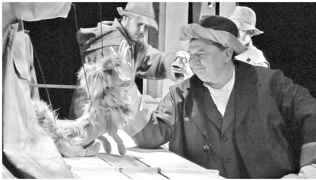
Реальна ли «артистическая» жизнь Каштанки – неважно. Важно то, что у нее есть выбор