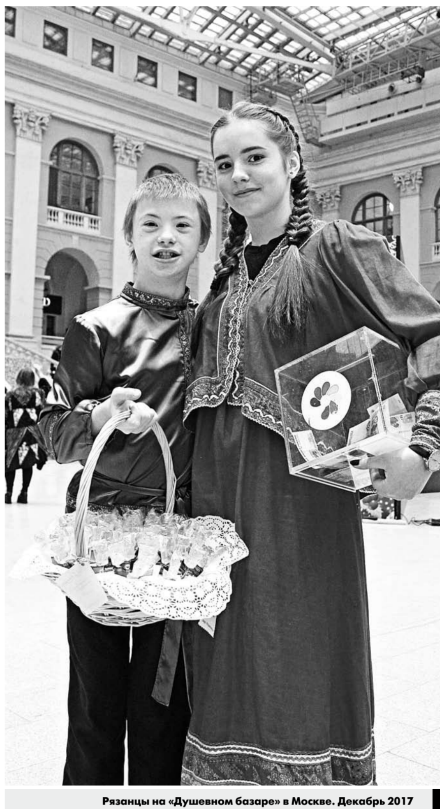
Рязанцы на «Душевном базаре» в Москве. Декабрь 2017

• Изданию книги-альбома «Каширин. Рассказывают рязанцы» о жизни и творчестве Е.Н. Каширина. До 26 сентября. Портал planeta.ru