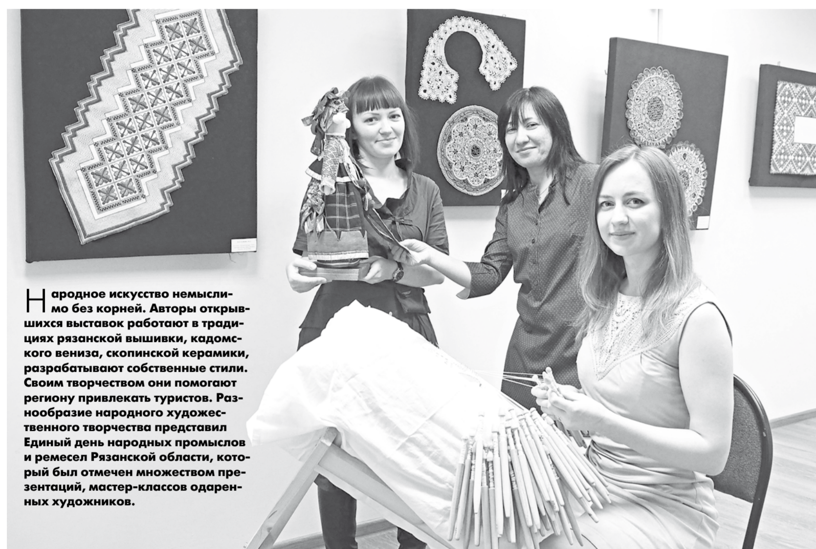
Рязанские художницы провели мастер-классы

НАРОДНЫЕ ПРОМЫСЛЫ И РЕМЕСЛА ПРОДОЛЖАЮТ ВДОХНОВЛЯТЬ РЯЗАНСКИХ ХУДОЖНИКОВ