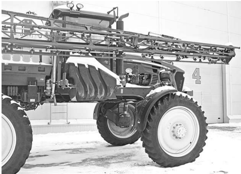
Новая техника ждет покупателей

Первый на нашем маршруте — дилерский центр «Эко Нива-Техника». Он расположен возле трассы М-5, в Рязанском районе. Это крупный центр поставки сельскохозяйственной техники мировых брендов. Предложения формируются выгодными пакетами, а потому большая часть хозяйств региона уже вооружилась с помощью центра тракторами, навесным оборудованием и комбайнами. Стоимость техники высокая, но есть гибкие программы лизинга, а также система «трейд-ин», которая позволяет снизить цену новых машин в зачет сдаваемых старых. Еще одна привлекательная сторона центра — сервисное обслуживание. Оно здесь организовано на самом современном