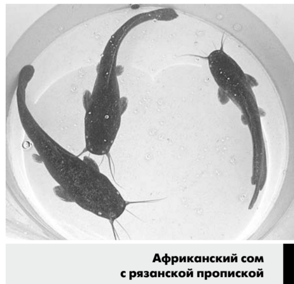
Африканский сом с рязанской пропиской