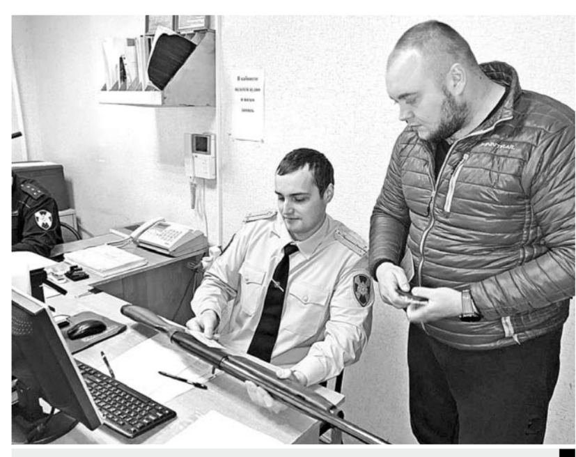
Все на учете и под контролем

О.С. — Запрещается ношение оружия в состоянии опьянения. Также гражданин не может иметь при себе оружие во время участия в собраниях, митингах, демонстрациях, шествиях, пикетированиях, религиозных обрядах и церемониях, культурно-развлекательных, спортивных и иных публичных мероприятиях, за исключением лиц, которым предоставлено право ношения в военной форме одежды отдельных моделей боевого холодного клинкового оружия (кортиков).