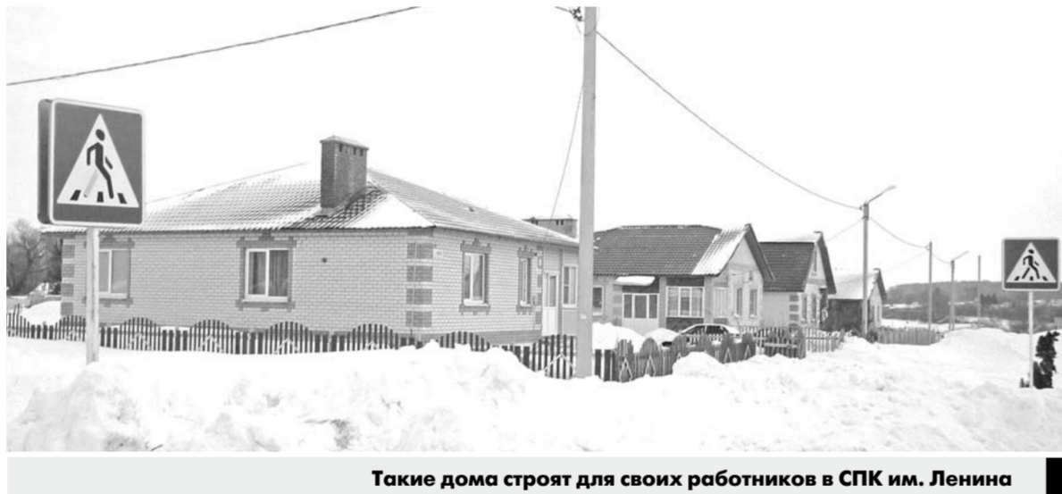
Такие дома строят для своих работников в СПК им. Ленина