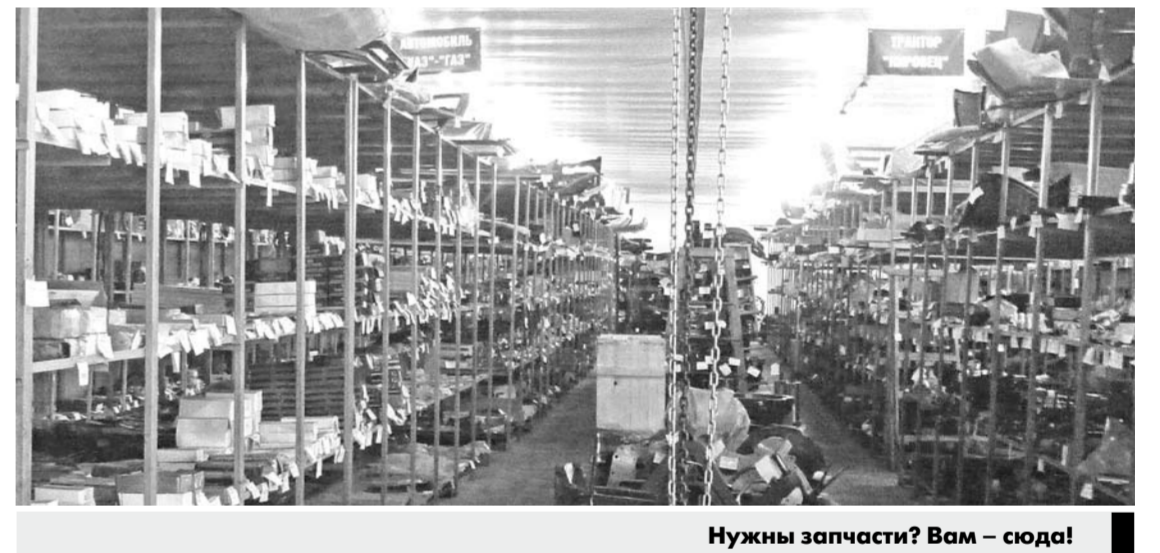
Нужны запчасти? Вам — сюда!