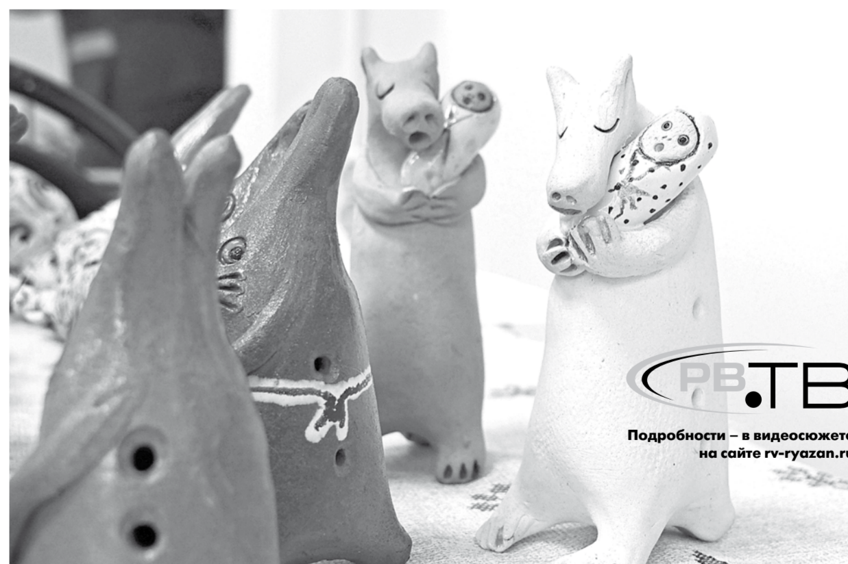
Глиняные миниатюры Ольги Шириня

РВ.ТВ Подробности – в видеосюжете на сайте rv-ryazan.ru