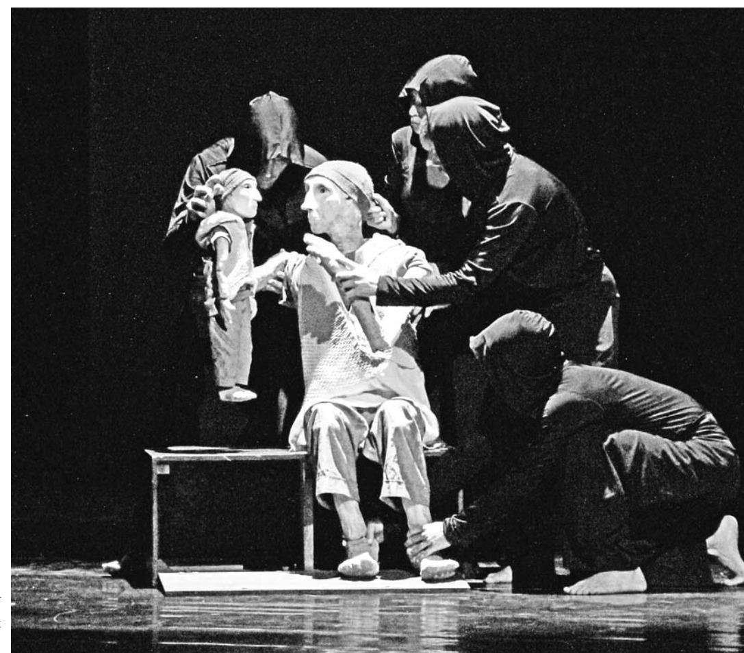
История о человеке с несколькими душами от испанского театра Zero en Conduca