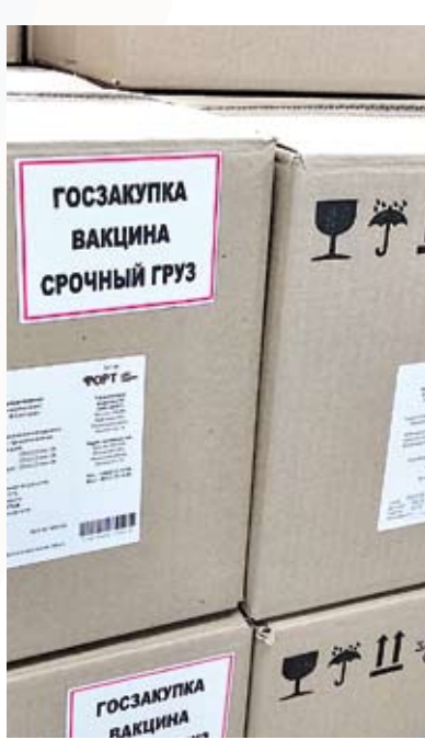
Новая вакцина соответствует всем рекомендациям ВОЗ, это первый российский препарат такого состава для профилактики гриппа

Биофармацевтическая компания «Форт», которая входит в Marathon Group и «Нацимбио» государственной «Ростех», открыла свое предприятие на рязанской земле пять лет назад. За это время производство выросло не только количественно, но и качественно. В июле 2019 года завод начал производство четырехвалентной вакцины от гриппа «Ультрикс Квадри». Этот инновационный препарат для иммунизации взрослых успешно прошел регистрацию в Минздраве России и уже начал массово применяться в стране.