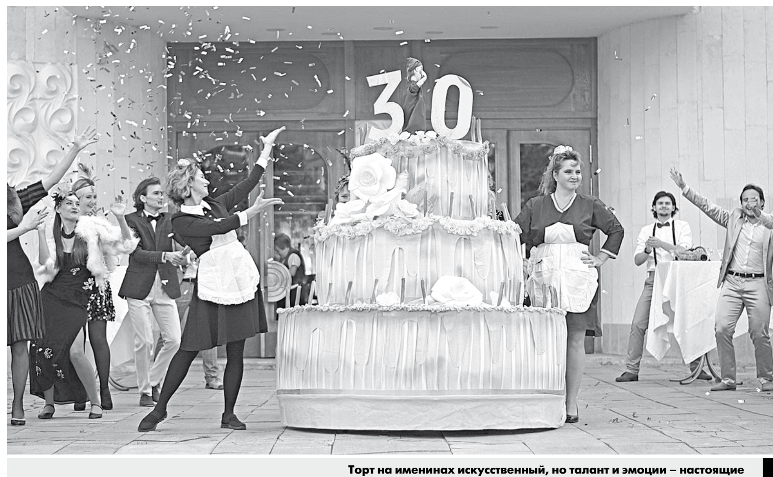
Торт на именинах искусственный, но талант и эмоции – настоящие