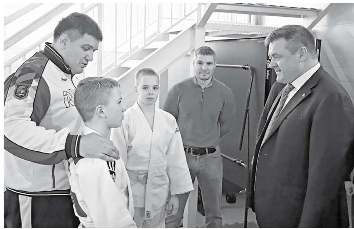
Юные спортсмены получили хорошую базу для тренировок

Жители района обратились к губернатору с просьбой о ремонте дорожного полотна на улице Трудовой