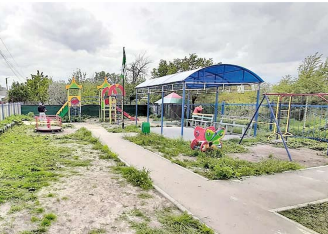
Детская площадка ТОС на ул. Пойменной

ГОСУДАРСТВЕННЫЕ ПРОГРАММЫ ПОМОГАЮТ РАЗВИВАТЬ ТЕРРИТОРИАЛЬНОЕ САМОУПРАВЛЕНИЕ