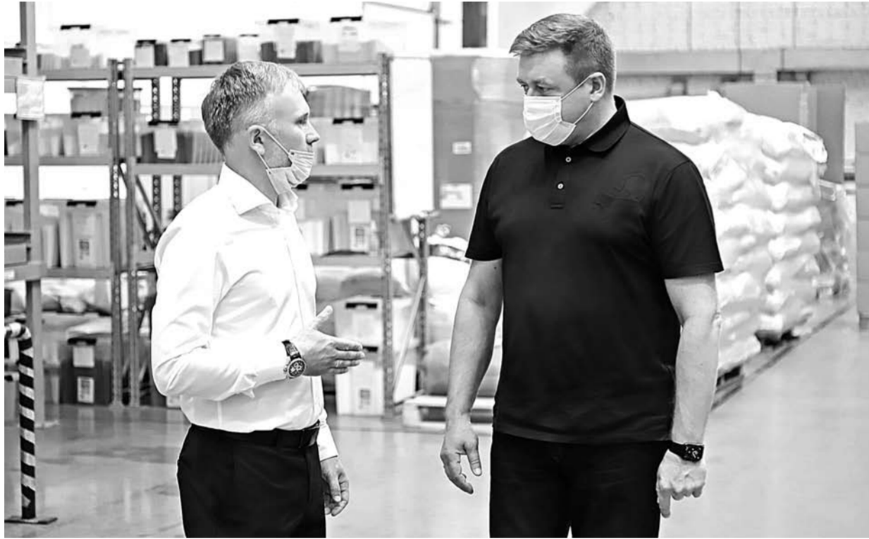
У предприятия появились партнеры за рубежом

Два года назад здесь находились разрушенные помещения бывшего завода железобетонных изделий. Производственные площади, которые раньше выпускали детали для строительства, стали пустовать после изменения строительных технологий. Рязанская фирма «Вега» тогда взяла на себя большую ответственность – не только реконструировать производственную площадку, но и создать здесь передовое литейное производство. Сегодня оно в числе лидеров среди предприятий, производящих изделия из пластмассы методом литья под давлением.