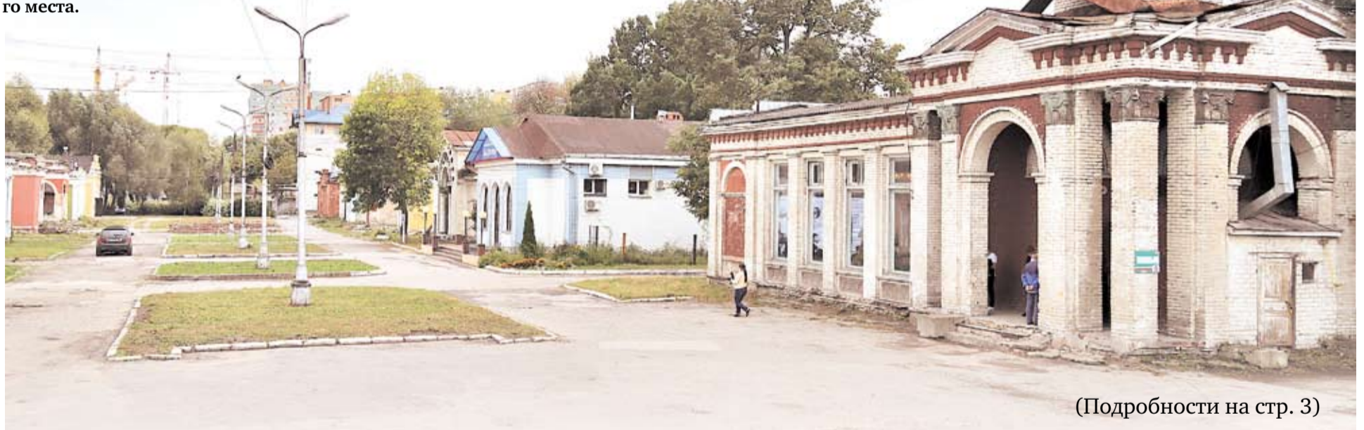
(Подробности на стр. 3)

ДО КОНЦА 2022 ГОДА ПЛАНИРУЕТСЯ РЕКОНСТРУИРОВАТЬ ТОРГОВЫЙ ГОРОДОК В РЯЗАНИ