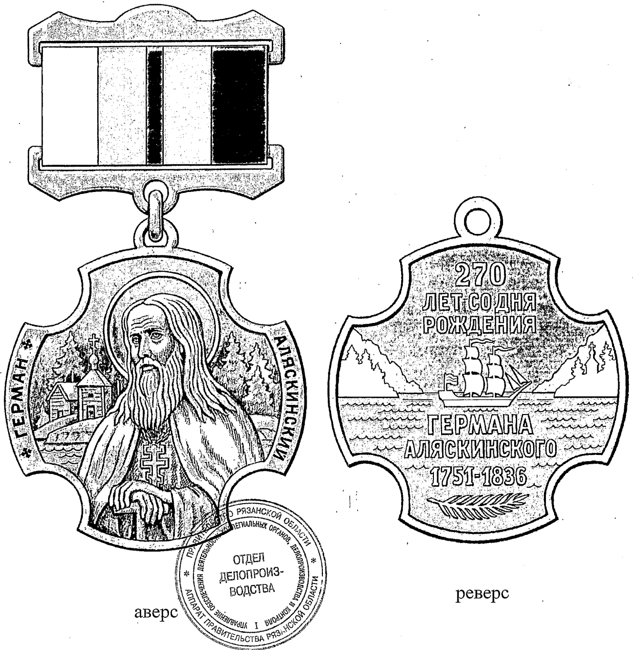
Рисунок памятного знака Губернатора Рязанской области «270 лет со дня рождения Германа Аляскинского»