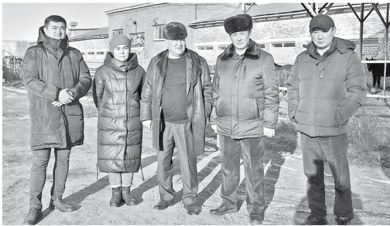
Делегация НИИ животноводства и кормопроизводства Республики Казахстан