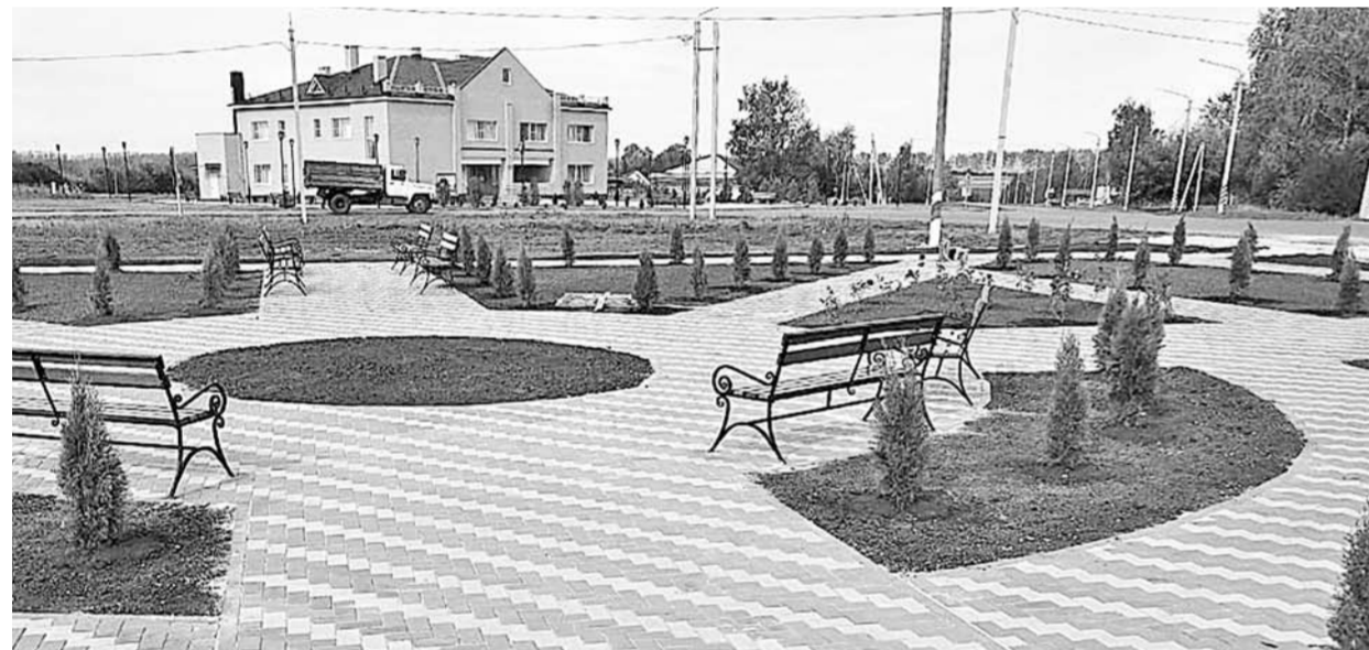
Парк отдыха и новый ДК в селе Благие

организационная работа жителей и органов местной власти с жителями. Позади — сельские сходы, обсуждение местных проблем и выбор из их числа не терпящих отлагательств. Подготовка необходимой проектно-сметной и иной (немалого объема) документации, участие в процедуре конкурсного отбора проектов на уровне региона для включения в профильную программу и другие обязательные процедуры и дей-