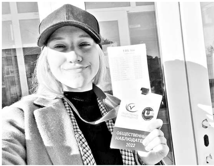
Более 2000 общественных наблюдателей работали на избирательных участках

сельские районы области, напрямую общался с людьми, получал информацию из первых уст.