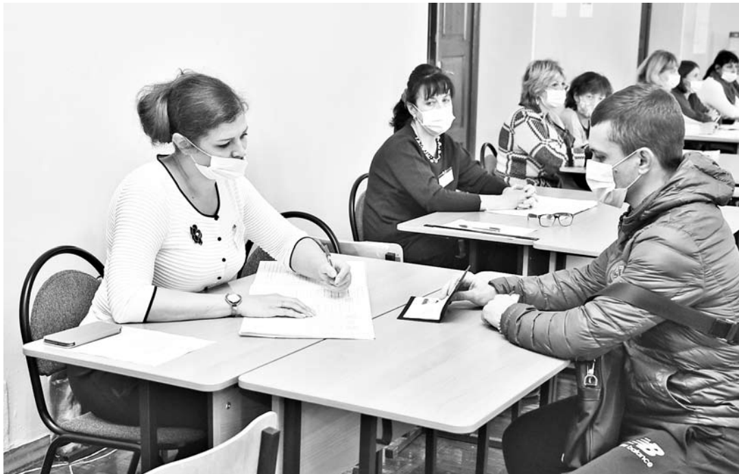
На избирательном участке 1023

«Нынешняя избирательная кампания подтвердила высокую устойчивость и