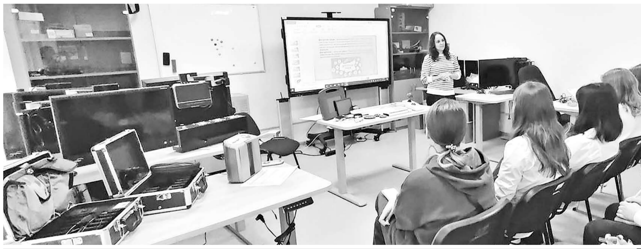
Знакомство студентов-медиков со специальными техническими средствами обучения инвалидов, в том числе людей с нарушениями зрения

По материалам сайта правительства области