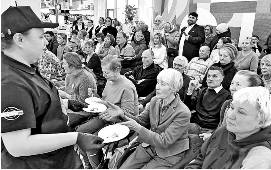
Рязанское угощение пришлось по вкусу гостям