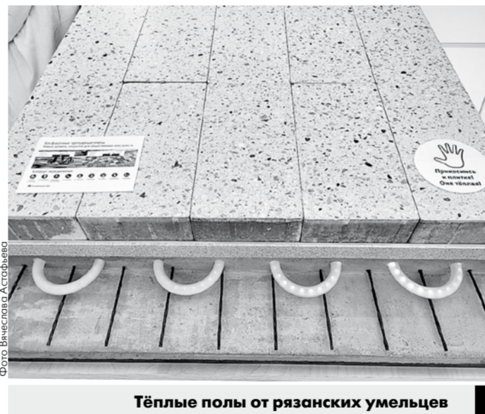
Тёплые полы от рязанских умельцев