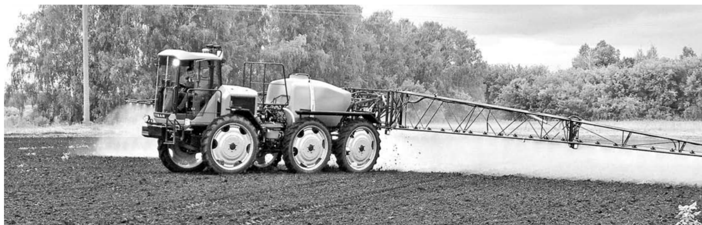
Новая техника – в помощь аграриям

российской разработкой. Модульную конструкцию создали специалисты завода «Пегас-Агро», который входит в пятерку крупнейших российских предприятий сельхозмашиностроения. Шины низкого давления позволяют технике работать на полях даже по тонкой ледяной корке и влагонасыщенной почве, не оставляя колеи, не приминая растения в ранней фазе развития. Машинные легко преодолевают неровности ландшафта, что позволяет начать работы в поле в среднем на две недели раньше, чем с техникой предыдущего поколения.