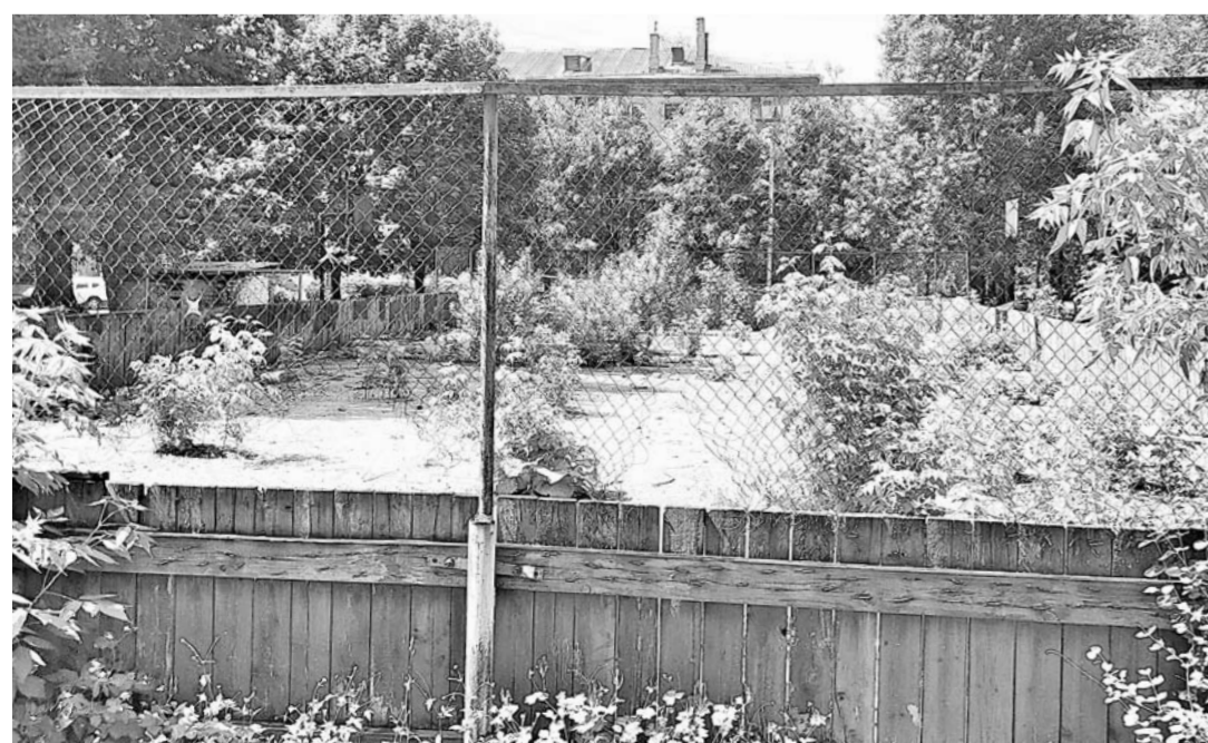
Так сегодня выглядит спортивная площадка во дворе дома №10 по ул. Трудовой

ОТ РЕДАКЦИИ: В администрации Рязани наш специальный выпуск «Город и мы» внимательно читают. В нашем следующем выпуске 10 июля мы напишем о том, какие меры приняты по поводу бесхозной спортивной площадки во дворе дома № 10 по улице Трудовой в Рязани.