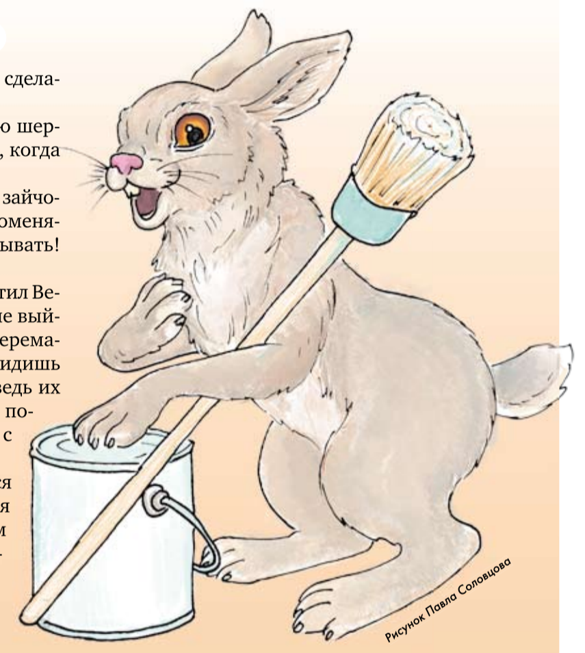
Рисунок Павла Соловцова

пора. Покрасим друг друга и дело сделано, будем спокойно ждать снег. – Но вам не надо красить свою шерстку! Она сама станет беленькой, когда придет время. – Такого не бывает! – засмеялся зайчонок, – как же шерстка сама цвет поменяет? Не нужно мне сказки рассказывать! Её красить надо! – Зря ты нам не веришь, – ответил Ведомостёнок, – ничего хорошего не выйдет, если вы друг друга краской перемажете. Ты посмотри на дерево. Видишь жёлтые листочки появились? А ведь их никто не красил. Они сами цвет поменяли. Осень им помогла. Так и с вашей шубкой будет. – А ведь и правда, – задумался зайчонок, – осень то оказывается волшебница! Пожалуй, не будем мы пока красить друг друга. Подождём, посмотрим на волшебство осени.