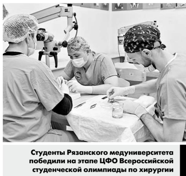
Студенты Рязанского медуниверситета победили на этапе ЦФО Всероссийской студенческой олимпиады по хирургии

5000 врачей и 10 000 сотрудников медицинского персонала трудятся в Рязанской области