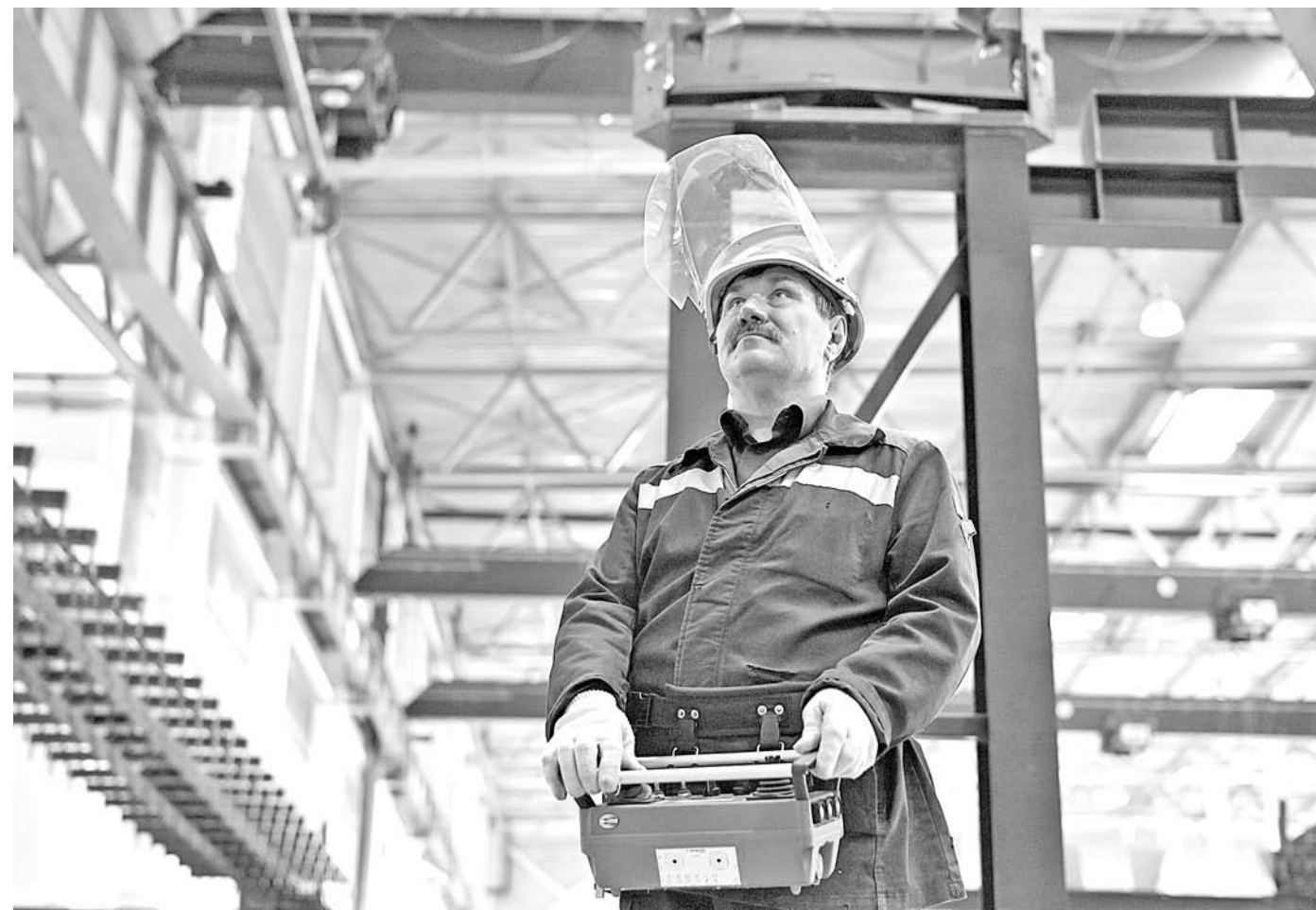
В 2024 году Рязанская область заняла четвертое место в ЦФО по росту промышленного производства

Наиболее нагляден пример Рязанской области, где, как известно, ни