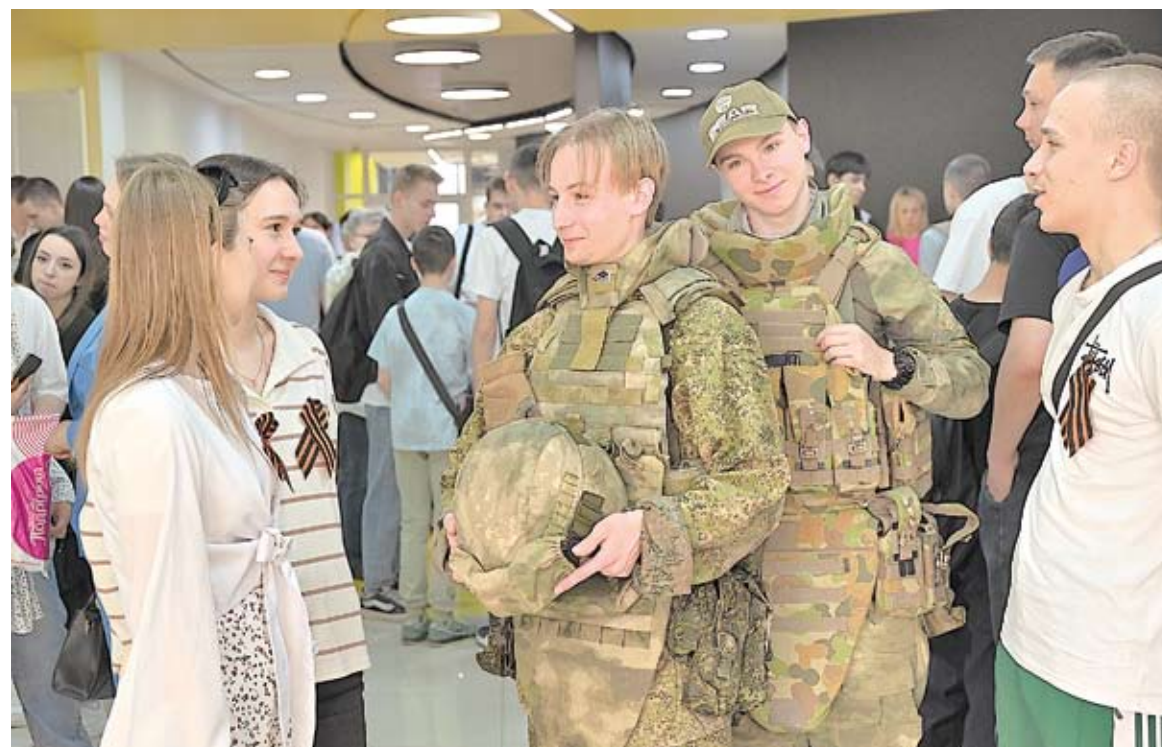
Современные образцы вооружения демонстрируют участники военно-патриотических клубов

VI МЕЖРЕГИОНАЛЬНЫЙ МОЛОДЁЖНЫЙ ПАТРИОТИЧЕСКИЙ ФОРУМ «НАУКА ПОБЕЖДАТЬ» ПРОШЁЛ В ОБЛАСТНОЙ БИБЛИОТЕКЕ ИМЕНИ ГОРЬКОГО