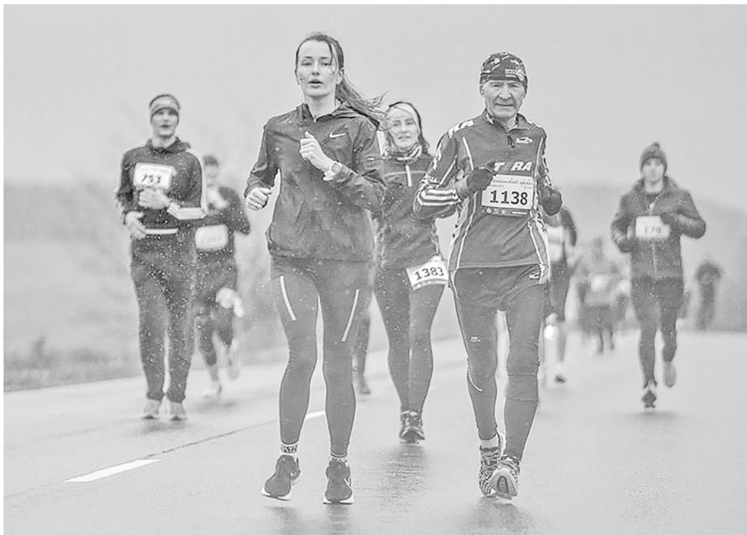
Есенинский полумарафон 2023 года прошёл под проливным дождём

Зимой под руководством своего тренера она много занималась в зале, выполняла специальные упражнения, готовилась к летнему сезону, и он для неё стал удачным.