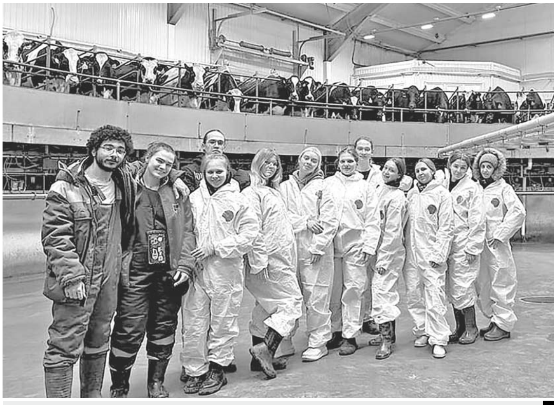
Семинар внутренней образовательной программы

Компания участвует и в программах целевого обучения. Благодаря им абитуриенты могут получить бесплатное среднее или высшее образование по специальности, востребованной в сельском хозяйстве. Будущие сотрудники группы могут выбрать один из 48 ссузов и