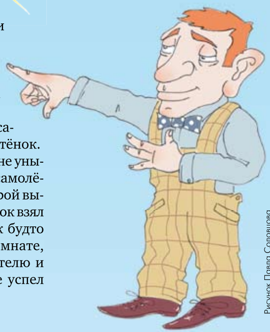
Рисунок Павла Соловцова

Так у наших друзей уборка превратилась в интересную игру, которую даже не хотелось заканчивать.