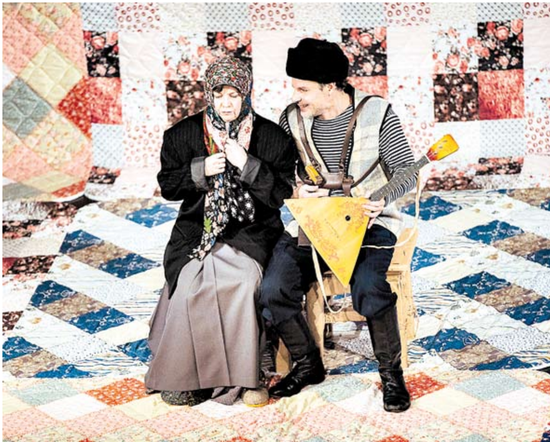
► Фото со спектакля «Космос, нервная система и шмат сала»

Именно ее так жаждут все герои спектакля Владимирского академического театра драмы «Фантазии Фарятьева». Ищут тепла, понимания, гармонии. Мать, терзаемая неустоенностью своих дочерей и пытающаяся вогнать их в рамки общественной «нормальной» жизни. Старшая дочь Шура, оглушенная слепым чувством к предавшему ее мужчине. Неисправимый идеалист Фарятьев, свято верящий в лучший – инопланетный! – мир.