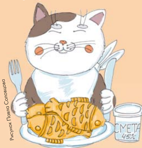
Рисунок Павла Соловцова

После того как у дамы Яги появился волшебный цветок, жизнь её сильно изменилась к лучшему. Теперь в её домике было тепло и уютно, и она с радостью приглашала к себе гостей. Совсем недавно у неё был великан Малыш, а сегодня она ждала в гости Ведомостёнка, Везунчика, Буковку и кота Пушка. Дама Яга напекла пирогов, поставила самовар и села у окна ждать гостей. И вдруг ей показалось, что огромная тень промелькнула под окном. Кто же такой большой ходит возле её дома?