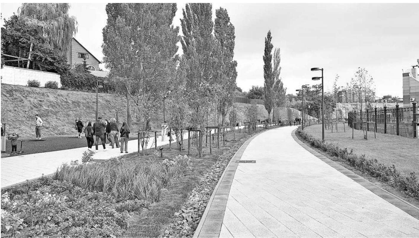
Министерство строительства и ЖКХ России включило территорию Лыбедского бульвара в топ-50 лучших проектов благоустройства страны