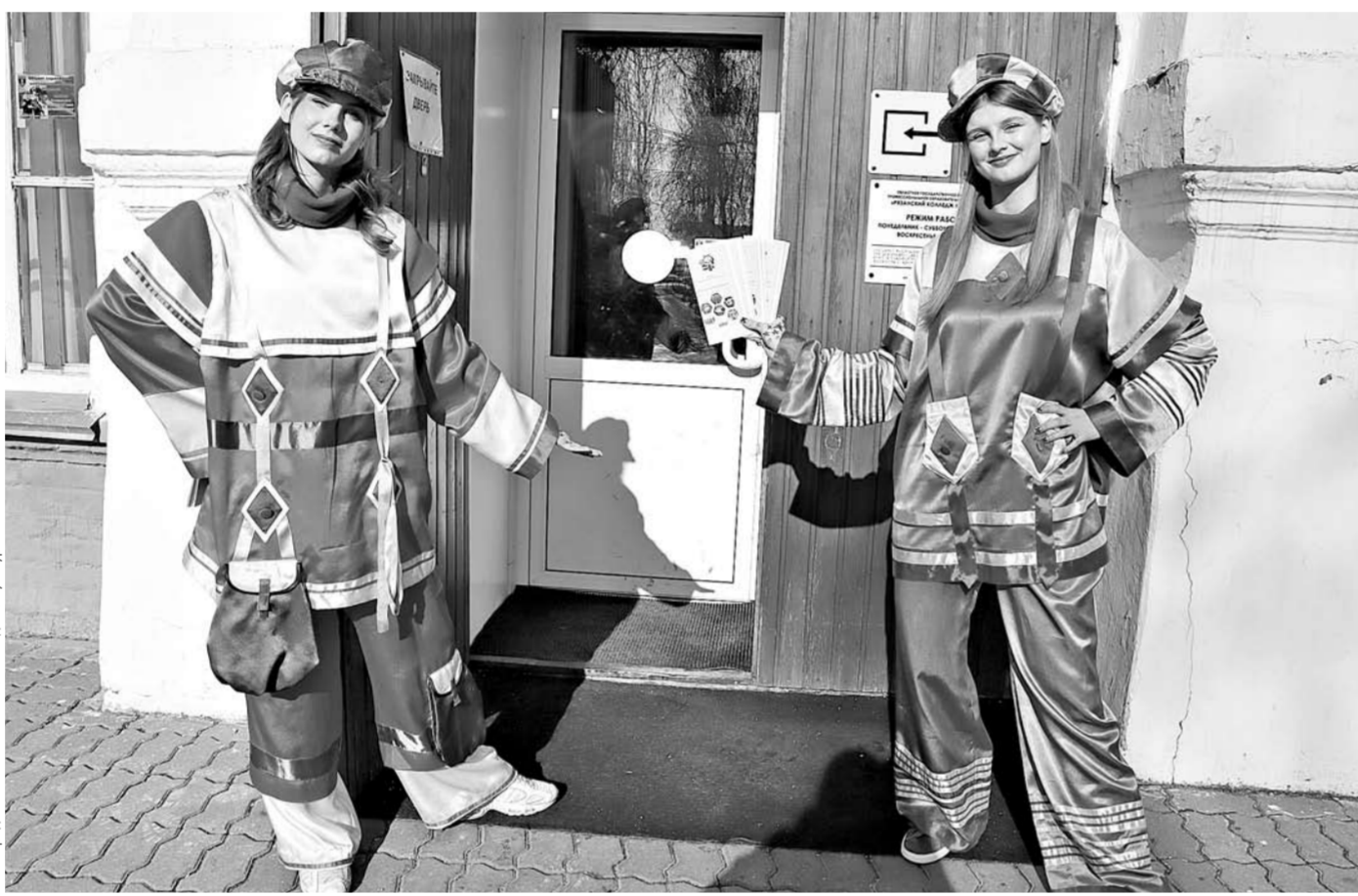
Двери распахнуты для будущих абитуриентов

Колледж готовит менеджеров социально-культурной деятельности. Это управленцы, они могут работать и работают в сельских клубах и домах культуры. Это и режиссеры массовых мероприятий. По направлению «народное художественное творчество» студенты обучаются хореографическому либо театральному делу и становятся руководителями любительского творческого коллектива или преподавателями. В прошлом году двое выпускников колледжа, хореографов, стали участниками программы «Земский работник культуры». Они учились по целевому направлению и работают