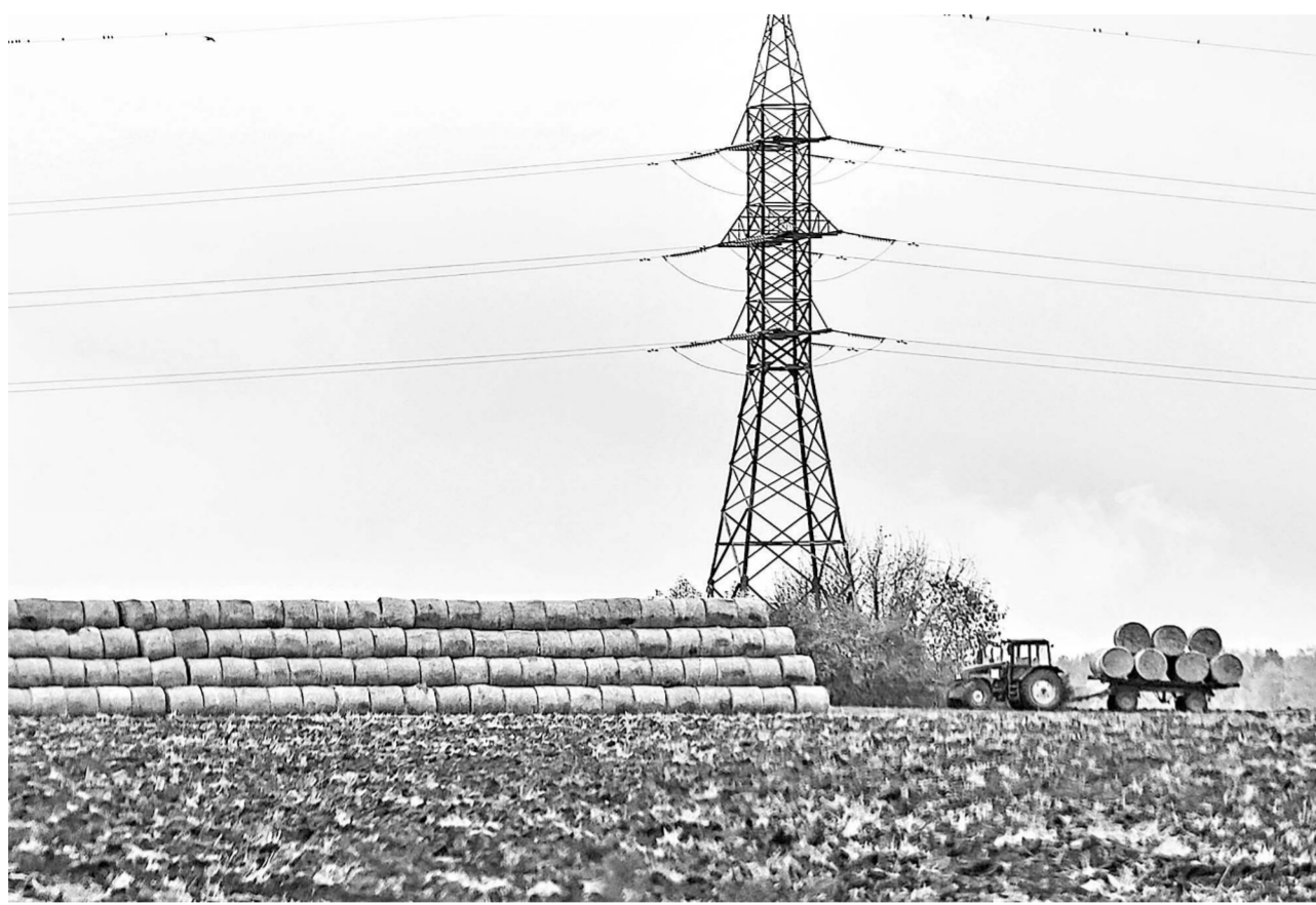
Около 5000 гектаров земли введены в сельскохозяйственный оборот в регионе в 2025 году

ОБЪЕКТЫ НЕДВИЖИМОСТИ ДОЛЖНЫ ПРИНОСИТЬ ПОЛЬЗУ ЛЮДЯМ