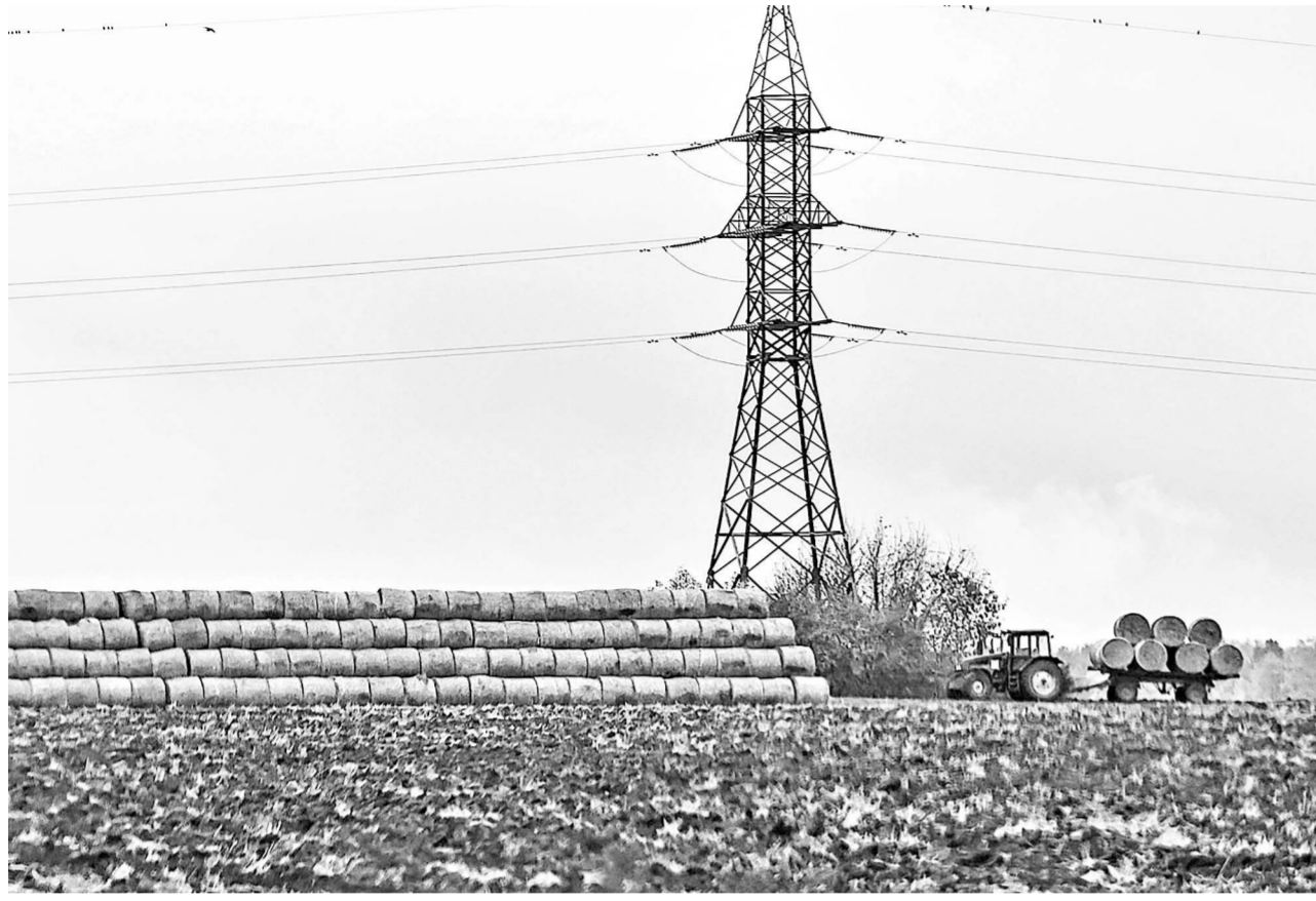
Около 5000 гектаров земли введены в сельскохозяйственный оборот в регионе в 2025 году

ОБЪЕКТЫ НЕДВИЖИМОСТИ ДОЛЖНЫ ПРИНОСИТЬ ПОЛЬЗУ ЛЮДЯМ