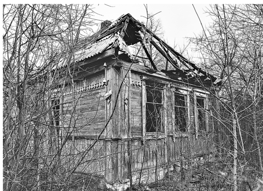
В Рязанской области провели инвентаризацию около 3000 заброшенных зданий, в том числе и находящихся в частной собственности. Составлены дорожные карты по их приведению в надлежащий вид. Работа идёт во всех муниципалитетах

На конференции также обсуждались вопросы цифровой трансформации в сфере государственного кадастрового учёта и регистрации прав, взаимодействия региональных систем по учёту и распоряжению государственным и муниципальным имуществом с федеральными ГИС и цифровыми платформами (ЕЦП «НСПД», ФГИС «ЕГРН», ГИИС «Электронный бюджет»).