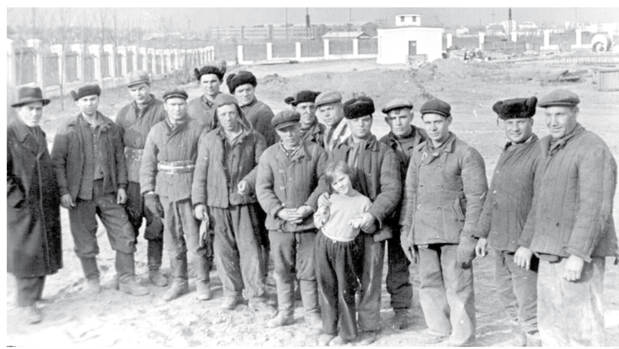
Бригада монтажников телецентра