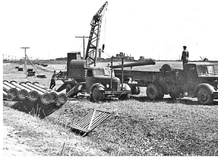
Перевозка деталей башни

В эти дни уместно вспомнить тех, кто стоял у истоков телевизионного вещания в Рязани. В газете «Приокская правда» от 7 ноября