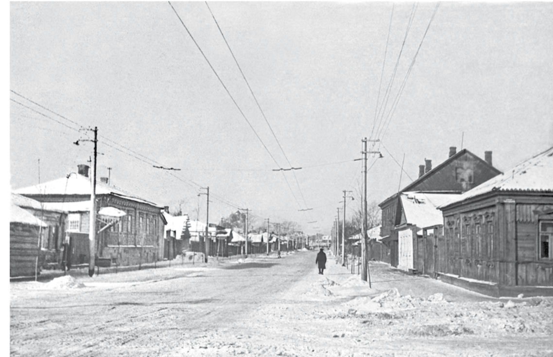
Улицы Грибоедова (Старогоршечная), 1950-е гг.

Свойны сохранились керосиновые лампы на случай отключения электричества. В лавке рядом с площадью Свободы керосин продавали в розлив. Им заправляли примусы, керогазы, лампы. В 1950-х в дома начали проводить газ.