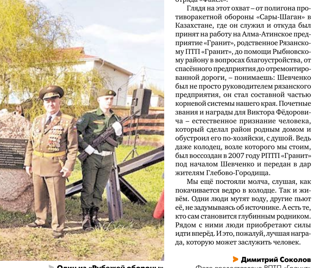
► Один из «Рубежей обороны»

20 МАЯ, СУББОТА 05:00 Т/с «Порт» 16+ 06:00 Х/ф «О нем» 16+ 07:30 Т/с «Порт» 16+ 08:30 Т/с «Между двух огней» 12+ 09:30 «Позовите Мышкину» 6+ 11:00 «Большое кино» 16+ 11:30 03:15 Т/с «Графия де Монсоро» 16+ 12:30 04:00 Т/с «Ковчег Марка» 16+ 13:15 15:15 02:15 «Сесиль в стране чудес» 12+ 14:00 «Новости» 16+ 14:15 «Знай наших» 16+ 14:45 «Магия вкуса» 12+ 16:00 «Новости» 16+ 17:15 Х/ф «Побеждай время» 16+ 19:00 «Новости. Пятница» 16+ 19:30 Т/с «Порт» 16+ 20:30 «В объективе» 16+ 21:00 «Новости. Пятница» 16+ 21:30 Х/ф «Битва» 16+ 23:00 «Большое кино» 16+ 23:30 «Ма-