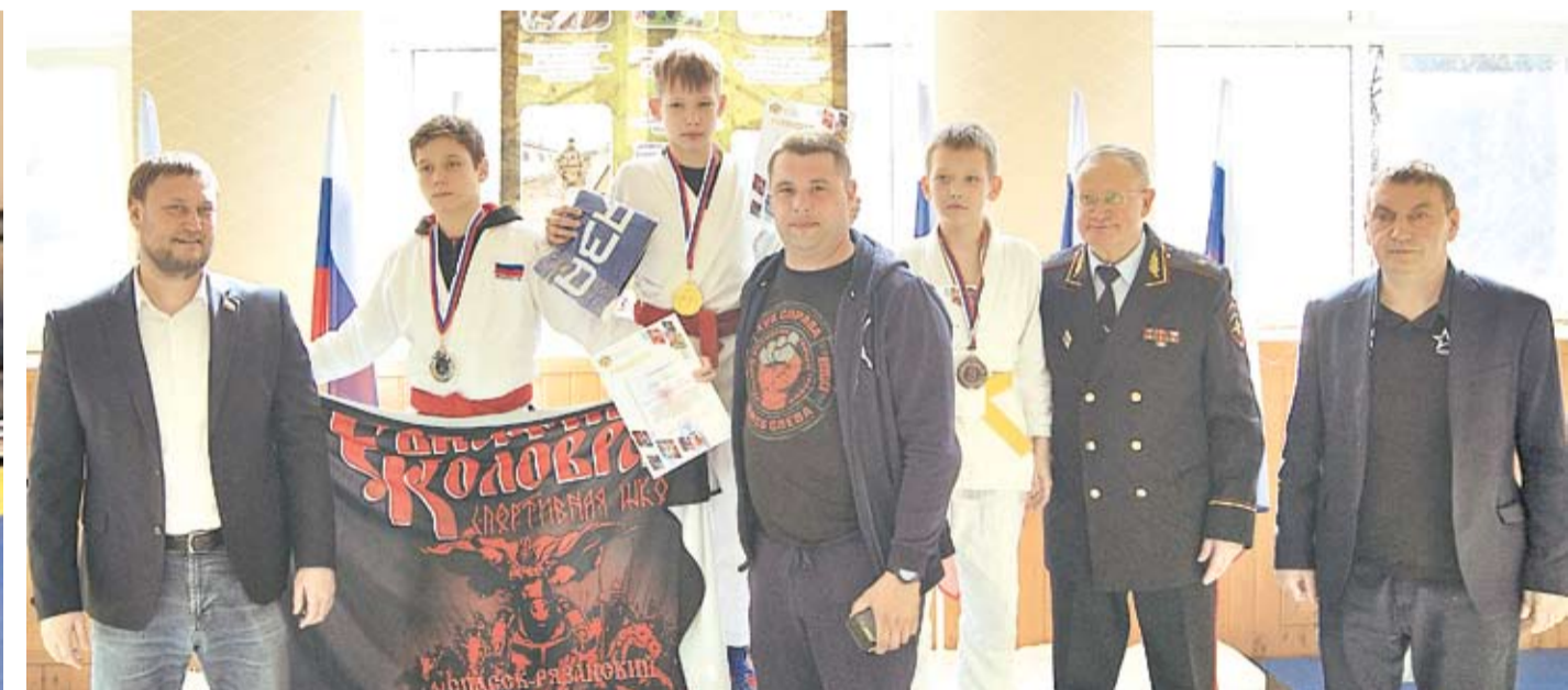
Награды получили достойные