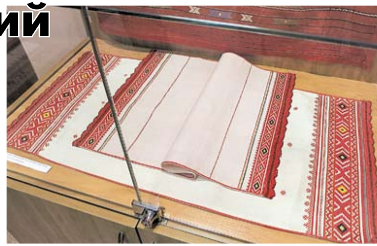
► Михайловское численное коклюшечное кружево