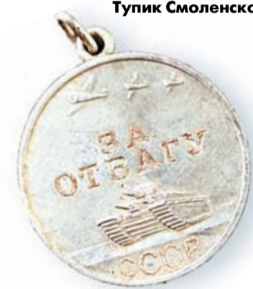
► Медаль Якова Чикова, найденная в Псковской области