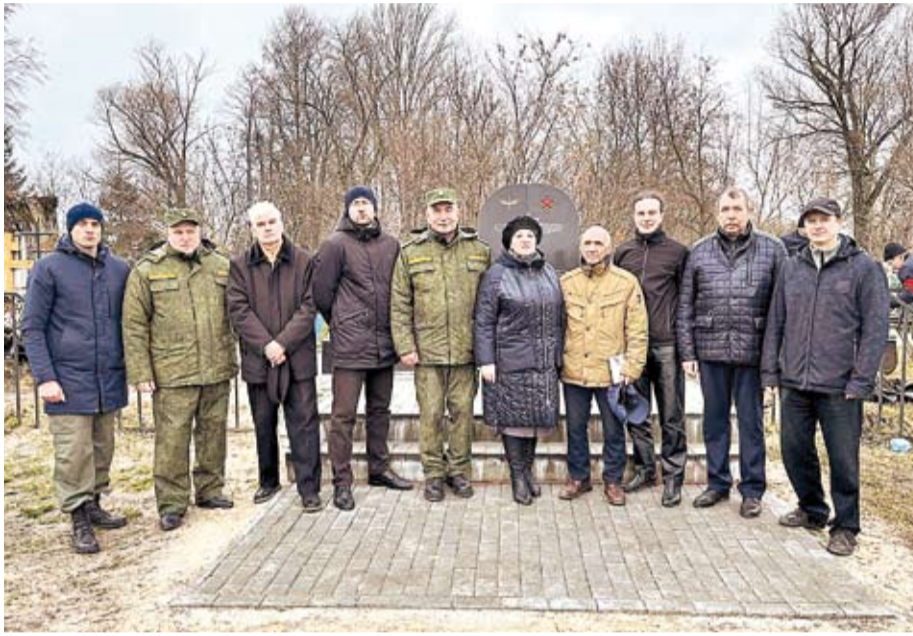
► Перезахоронение экипажа советского бомбардировщика, сбитого в годы войны в Кораблинском районе