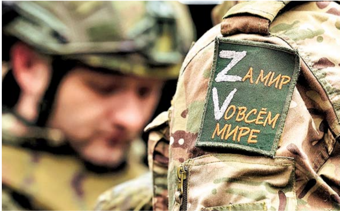
► Латинские буквы Z и V со временем породили целый пласт «Z-лексик»

В то же время аббревиатура СВО стала центральным элементом официального и медийного дискурса. Она выполняет важную психологическую функцию – придает происходящим событиям характер четко