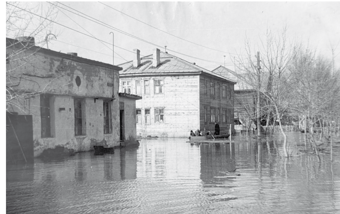
Улицы Рязани, затопленные разливом, 1970 г.

Мостовые основных улиц были булыжные, другие проезды и дорожки – грунтовые. Постепенно проезжие части стали покрываться асфальтом. Появился общественный транспорт. Первые автобусы были фургонного типа и открытой дверью. Их открывал и закрывал рукой водитель. Потом появились троллейбусы, маленькие и тесные, с кондуктором. Билет до первой остановки стоил 20 копеек, а до следующих – по 10 копеек за каждую. Гужевой транспорт ещё использовался повсюду. Даже скорая помощь из больницы Семашко представляла собой лишь телегу с впряжённой в неё лошадицу. На такой упряжке ехали кучер с медработником. Потом уже появились жёлтые машины с красным крестом. Начали ездить и легковые автомобили – «Победа», «Москвич», похожий на большую букашку, «Волга», считавшаяся тогда роскошью.