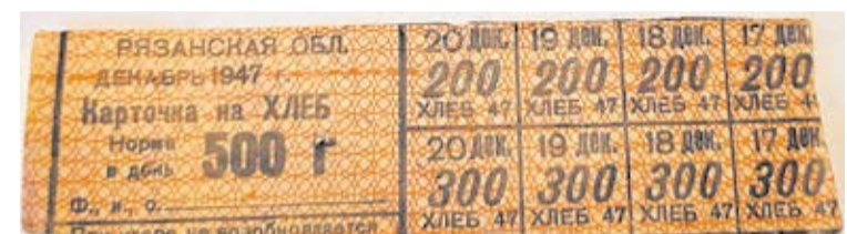
Талоны на еду, 1947 г.

У кого-то появились первые телевизоры, громоздкие, с маленьким экраном, который можно было прикрывать ладонью. Мы ходили смотреть передачи к нашим соседям – счастливым обладателям этого чуда.