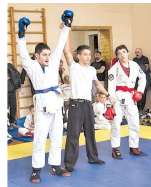
Радостный миг победы