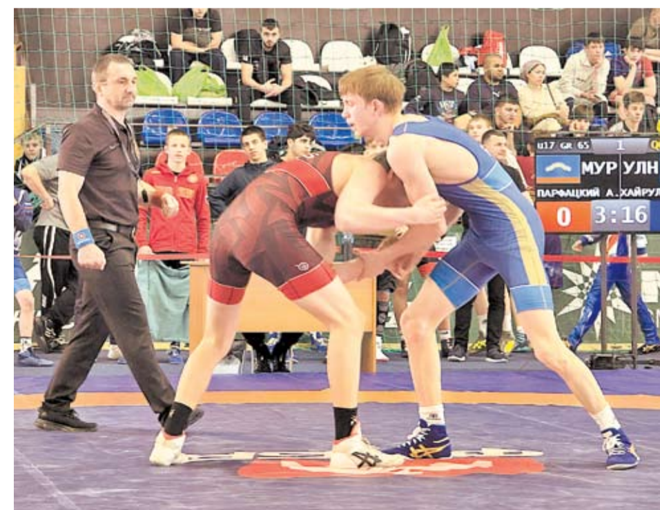
Любимый вид спорта Героя России Олега Дуканова

Олег Михайлович часто бывает в Рязанской области почетным гостем на спортивных соревнованиях и различных патриотических проектах.